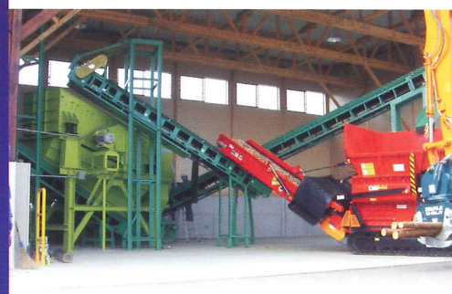
燃料用木チップ破碎後の粒度調整設備