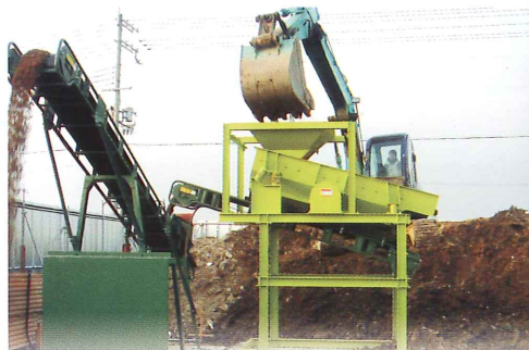
解体発生残土からの異物除去設備