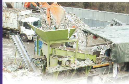
混合廃棄物手選別ラインの前処理(土砂抜き)設備