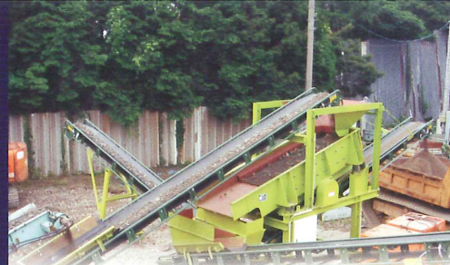
2段式仕様(オプション)による、 破碎後の廃コンクリート3種選別設備