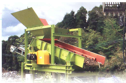
最終処分場での埋立前異物除去設備