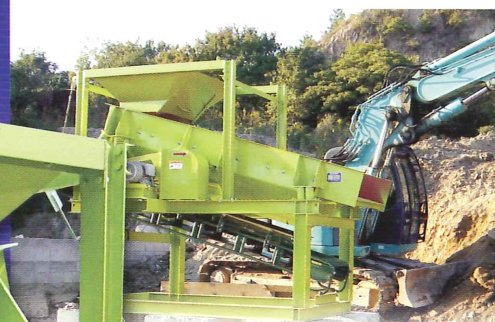
解体発生残土からの異物除去設備