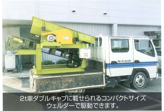
2t車ダブルキャブに載せられるコンパクトサイズ ウェルダで駆動できます。

弊社では、デモ専用の小型機を保有しております。 九州管内は無料で出張実演致します。 (九州以外の地域、離島などは別途ご相談下さい。) お気軽にお問い合わせ下さい。