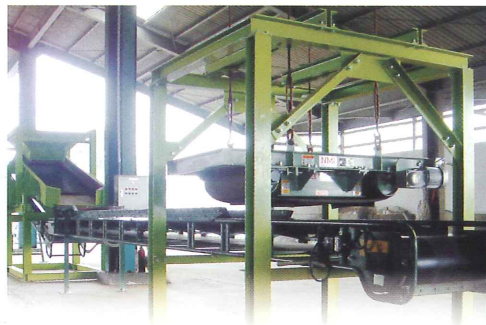
混合廃棄物手選別ラインの前処理(土砂抜き)設備