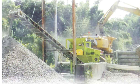
廃コンクリート破碎後の粒度調整設備